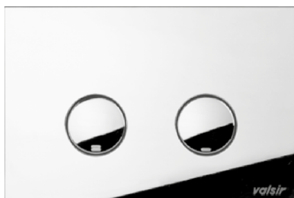
ABS cromo lucido